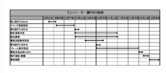
図 3 スケジュール

作業は、専門分野により担当を構造・機構部と動力・制御部の二つに分けてそれぞれで行うが、進捗状況に応じてメンバー全員での打ち合わせも行い、完成までのスケジュール調整（図 3）や製作中の装置についての意見交換等を行った。