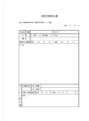
図2 技術支援申込書

課題テーマの一つ「エレベーター」は4学科の要素をすべて含んだテーマであり，そのサンプルを技術職員で製作し，学生指導上重要な点をあらかじめ把握することにした。